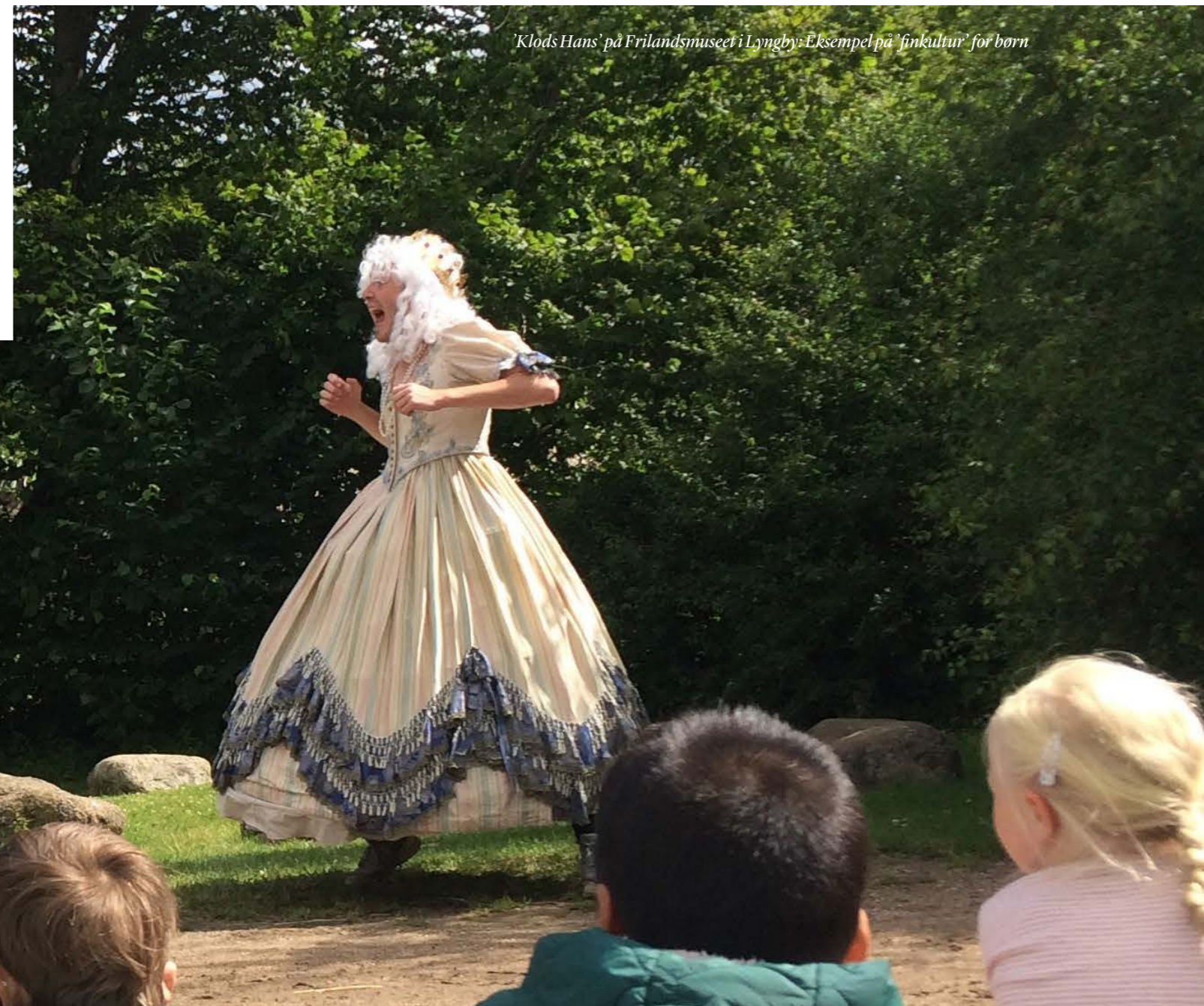
'Klods Hans' på Frilandsmuseet i Lyngby: Eksempel på 'finkultur' for børn

For det fjerde antages det, at sammenhængen mellem deltagelse i en fritids- og kulturaktivitet og deltagelse i frivilligt arbejde er stærkere, hvis den pågældende aktivitet dyrkes i en forening, end hvis aktiviteten ikke dyrkes i en forening.