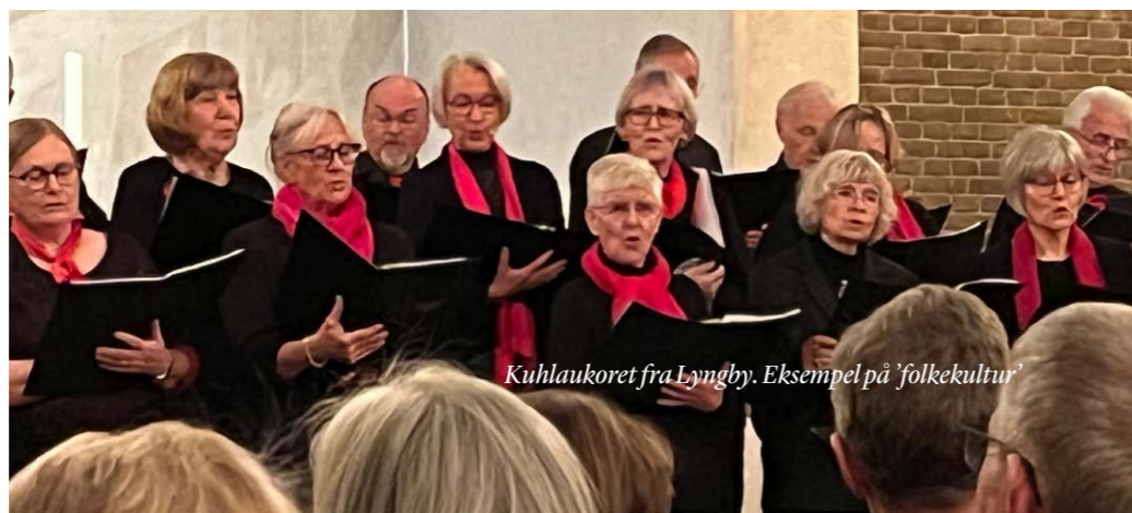
Kuhlaukoret fra Lyngby. Eksempel på 'folkekultur'

En del aktiviteter kan både betegnes som 'finkultur' og 'populærkultur'. Kolonnen til venstre viser andelen af respondenterne i Kulturvaneundersøgelsen, der i perioden fra 2018 til 2023 svarede, at de inden for de seneste tre måneder forud for besvarelsen af spørgsmålet havde været aktiv i den pågældende aktivitet (N = 57.028).