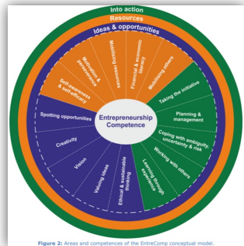
Figure 2: Areas and competences of the EntreComp conceptual model.

I SDU Entrepreneurship labs arbejdes der ud fra nedenstående model, når aktiviteterne skal tilpasses til aktuell undervisning.