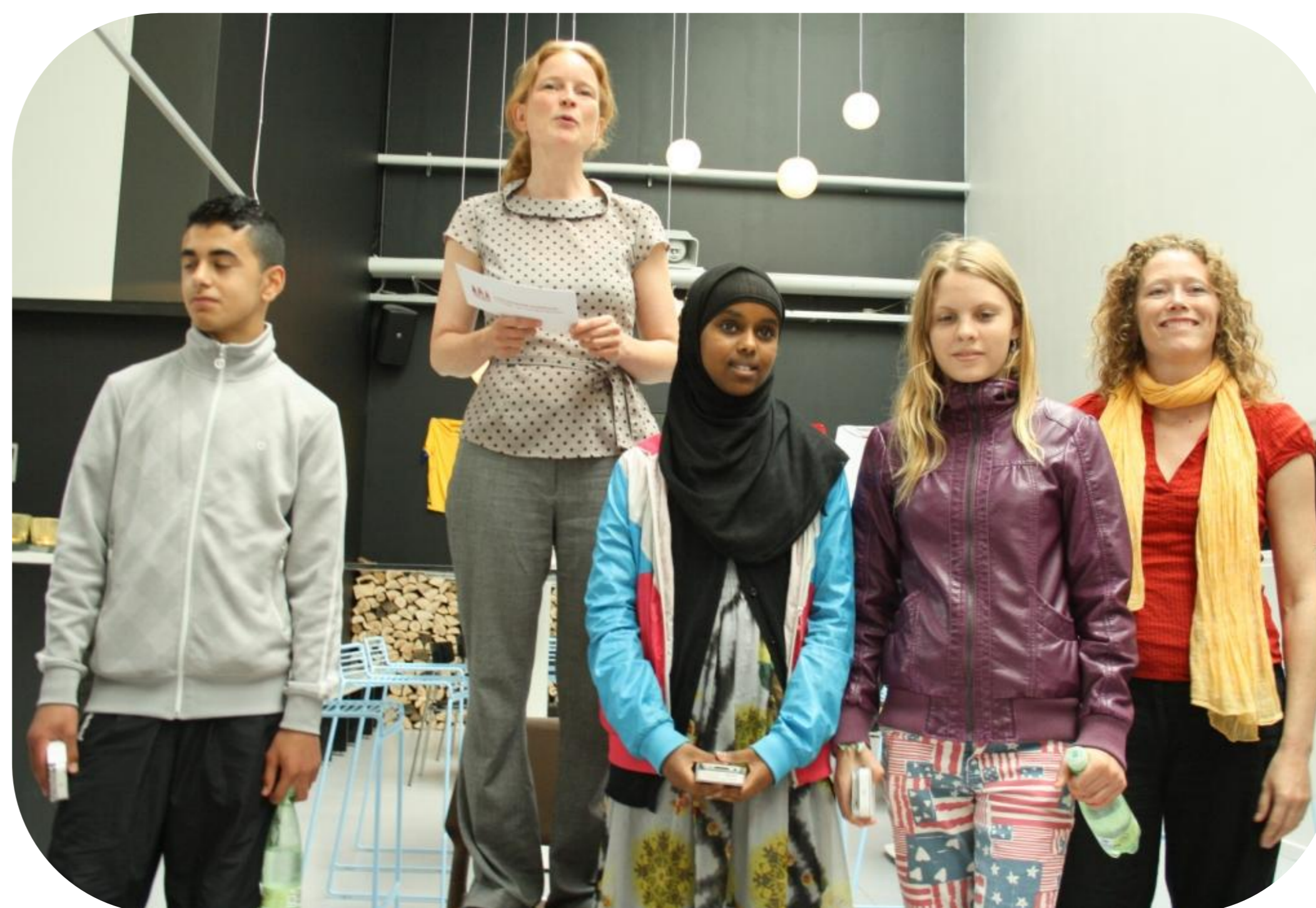
Sundhedsborgmesteren i København roste børnene i Haraldsgadekvarteret for deres indsats.

Over 600 børn på skoler omkring Haraldsgadekvarteret på Nørrebro har deltaget i et forskningsprojekt, som undersøger om nye legepladser og aktivitetssteder kan føre til mere bevægelse.