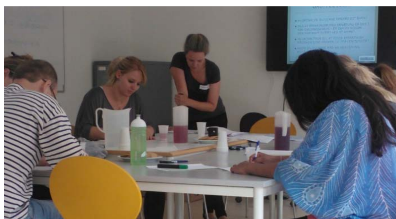
Deltagere i gang med en øvelse til pilottesten

Projektet er støttet af Kræftens Bekæmpelse