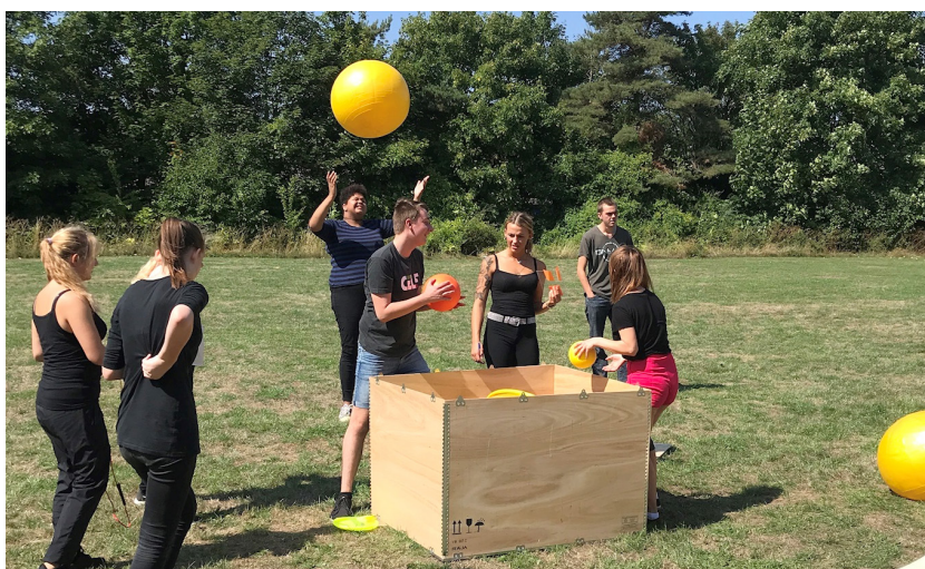
Erhvervsskoleelever fra CELF i Nykøbing Falster udvikler ideer til aktive pauser i workshoppen Young & Active.

Workshoppen Young & Active er oprindeligt udviklet til gymnasieelever og afprøves i perioden 2016-2018 på 15 gymnasier landet over som en del af centrets forskningsprojekt en go' Bgym'. Nu er turen kommet til andre ung-